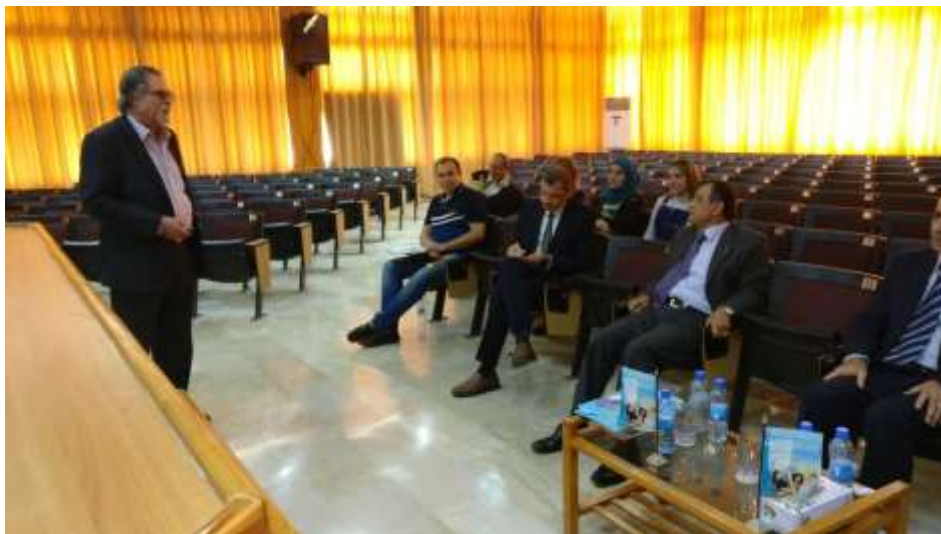
Picture8: Prof. Ghata presentation