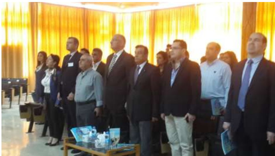
Picture1: the audience