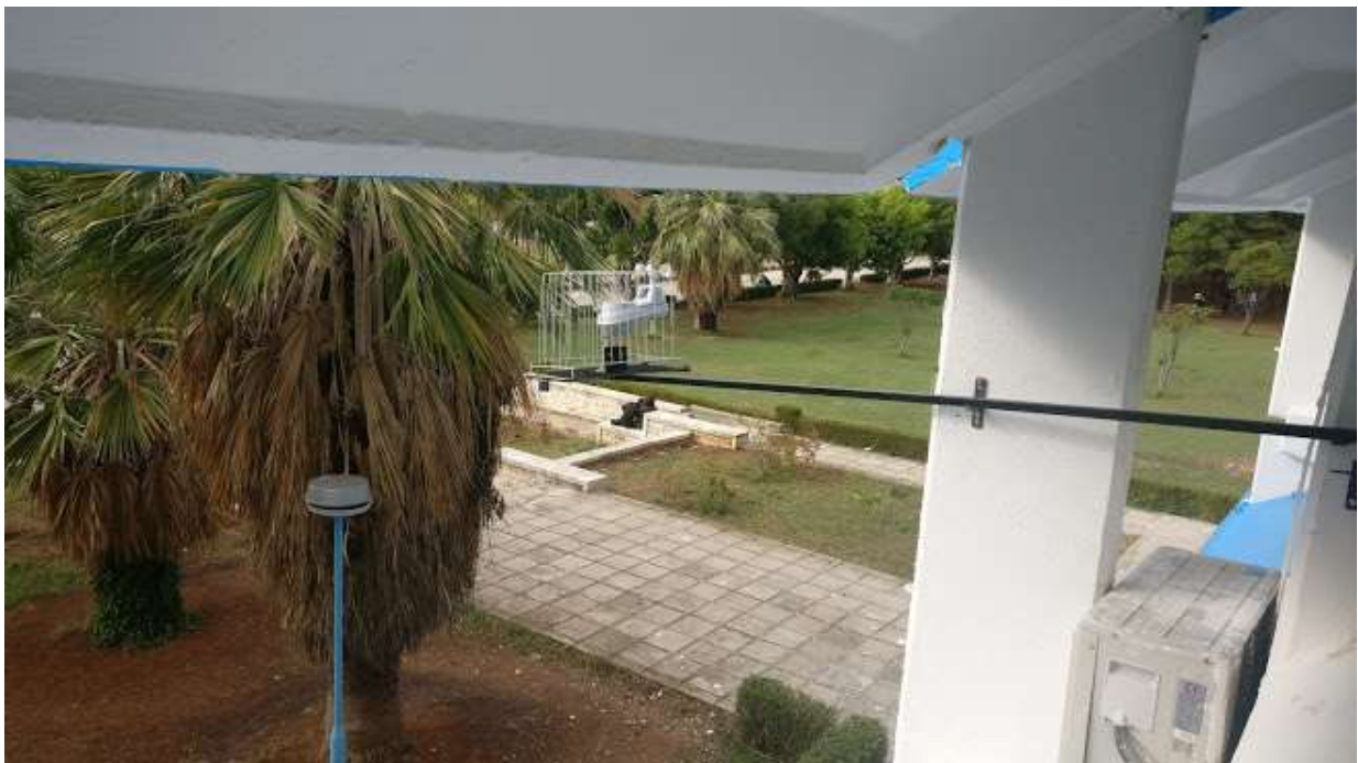
Picture10: weather station