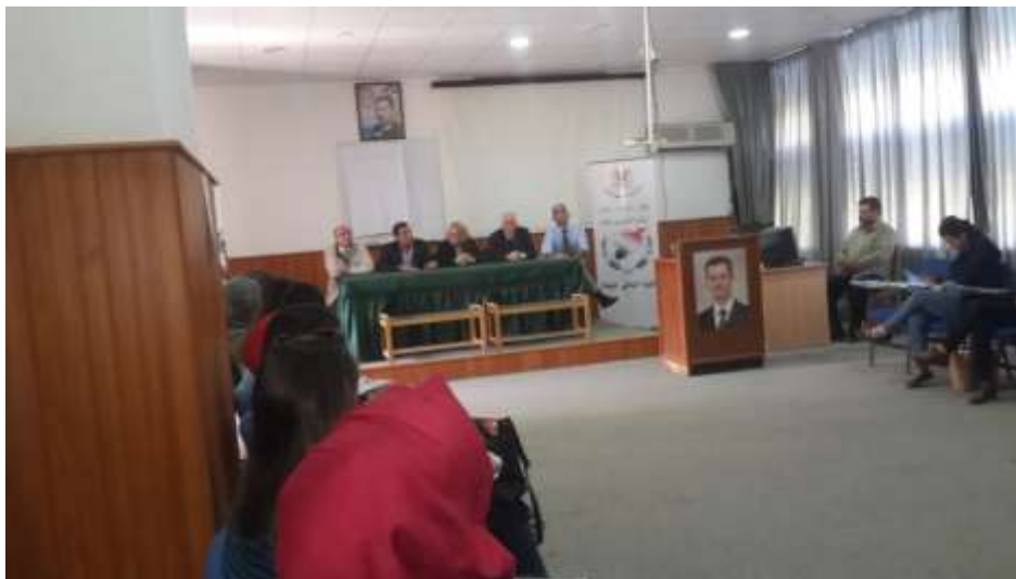
Picture16: the head session of the workshop