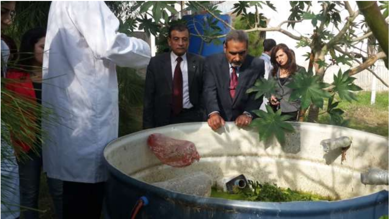
Picture13: a scientific visit of the workshop (application)