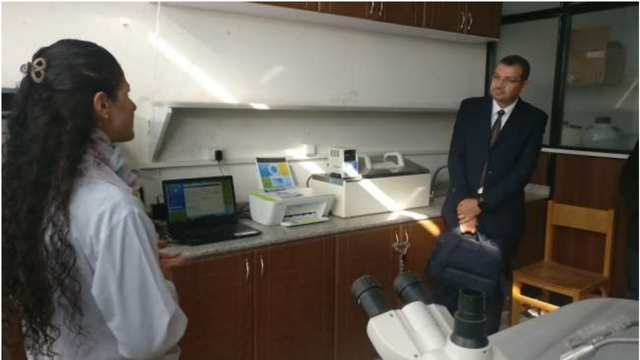
Picture11: accessories of the weather station