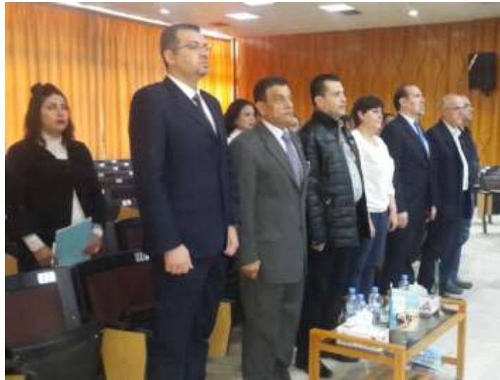
Picture4: the audience in the second day