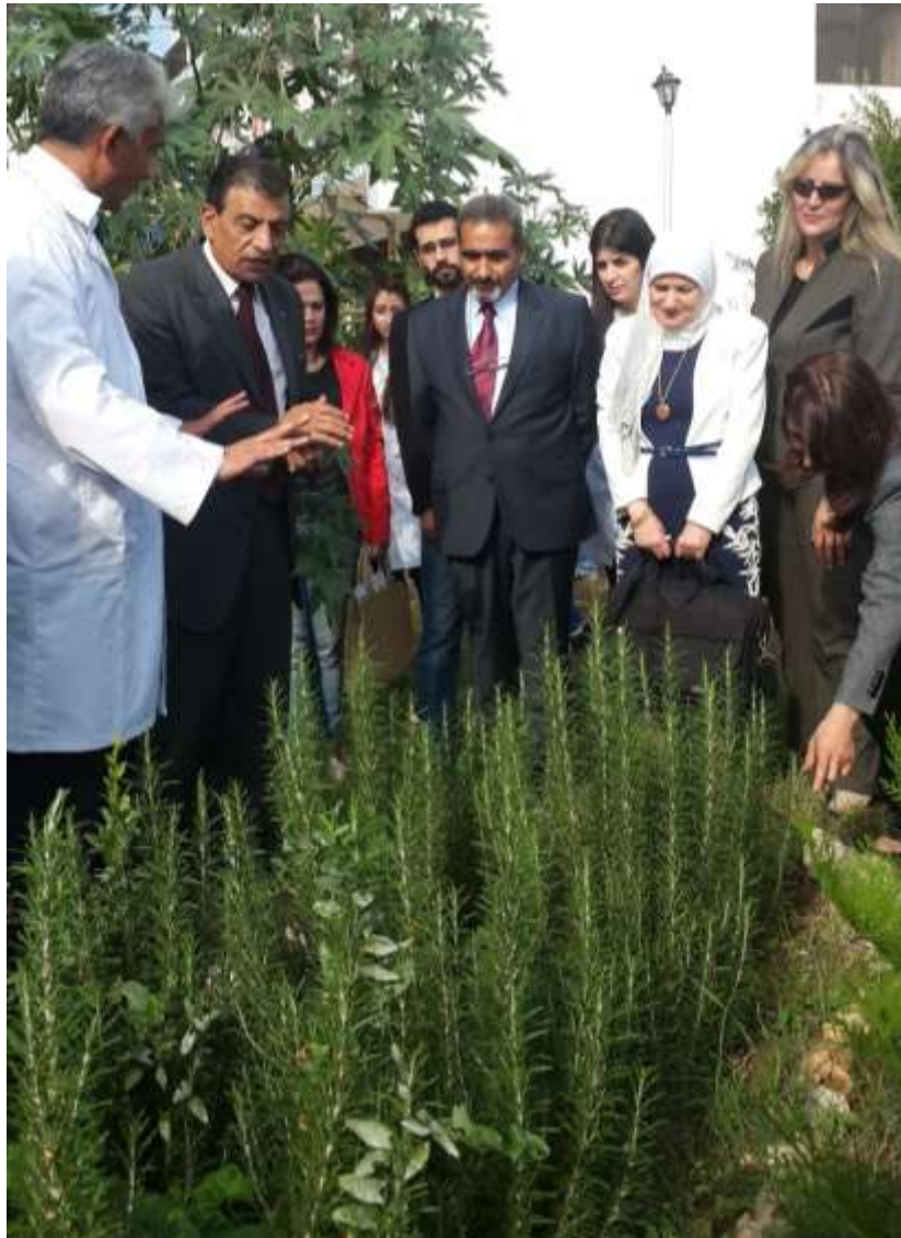
Picture15: a scientific visit (discussions)