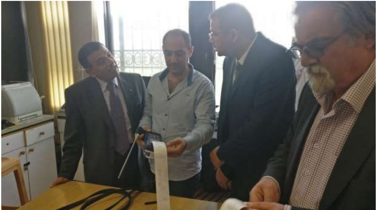
Picture9: gaz analyzer