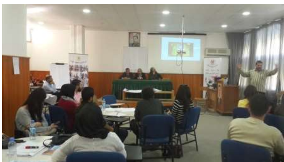
Picture18: random workshop presentation