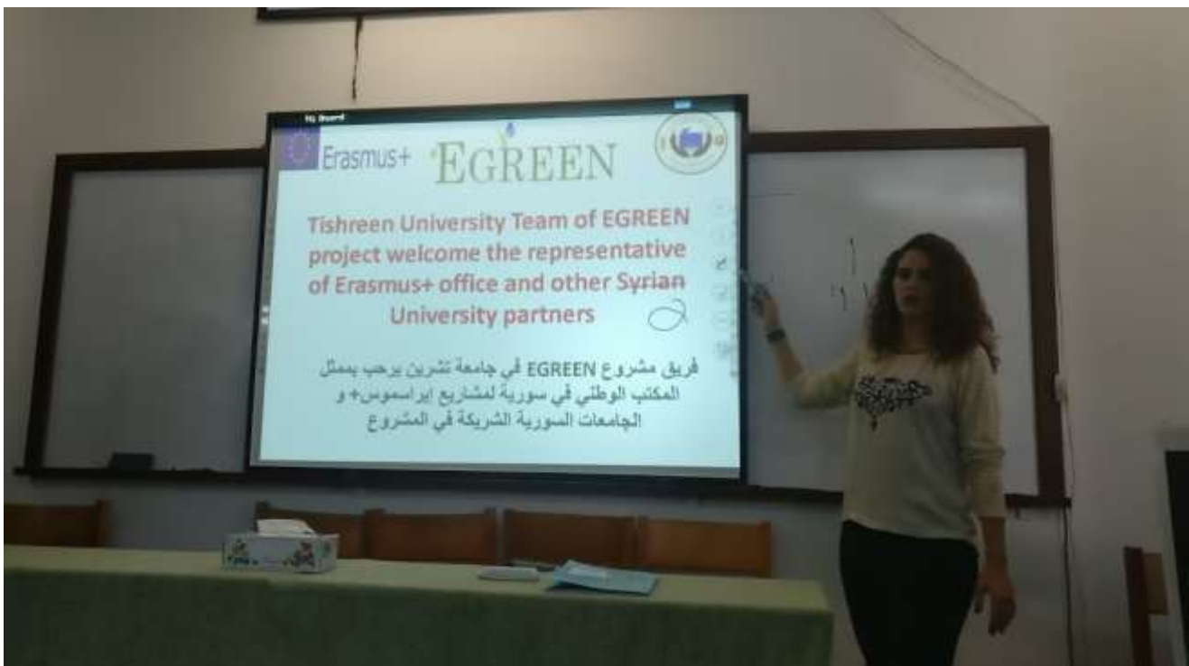
Picture12: office equipments as Smart Board, Computers and printers