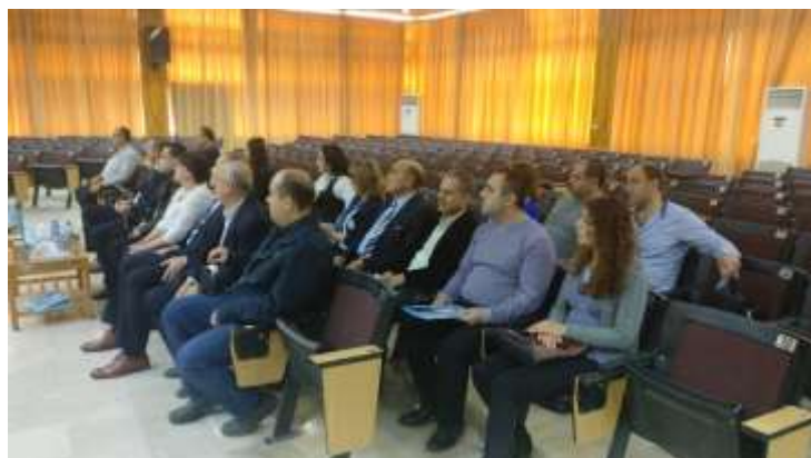
Picture6: the audience