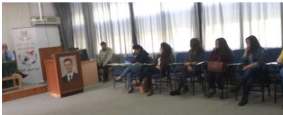
Picture17: the audience