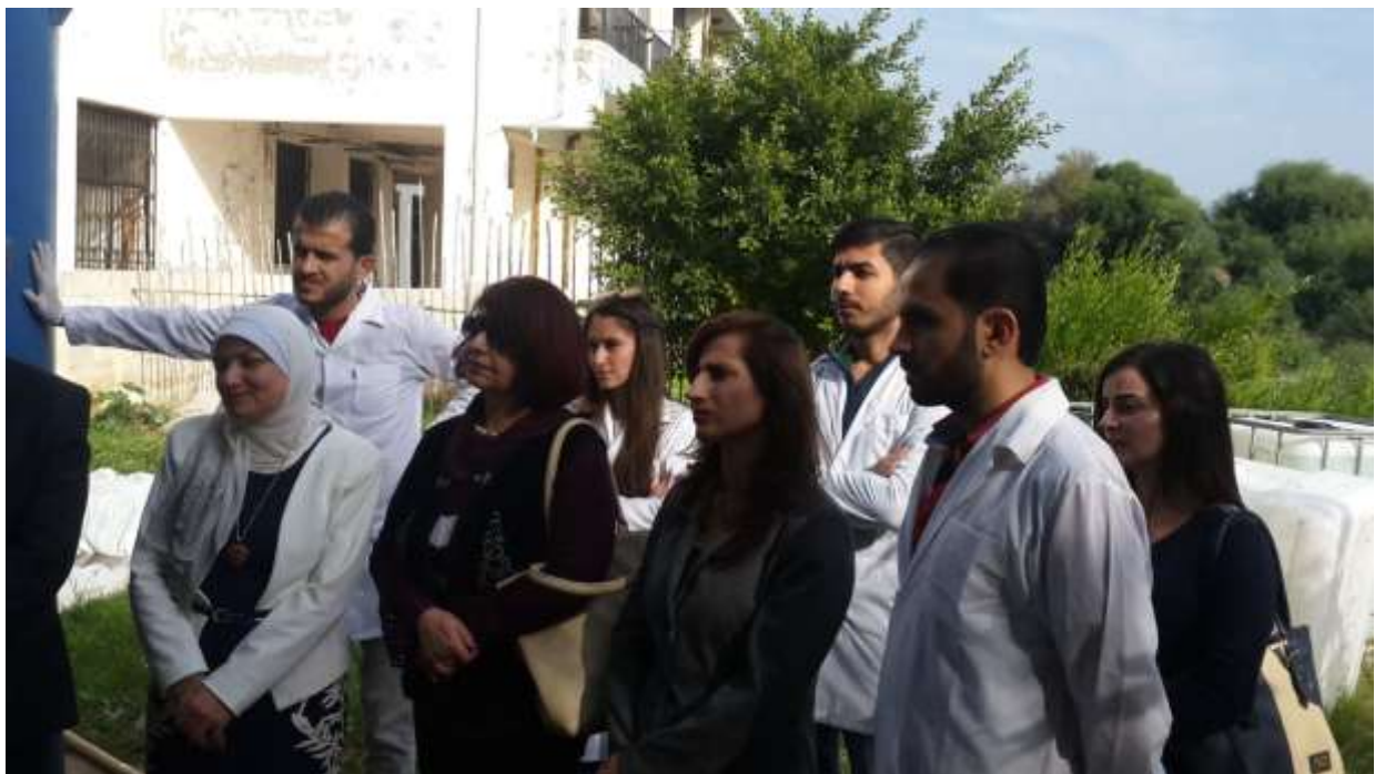
Picture14: a scientific visit of the workshop (visitors)