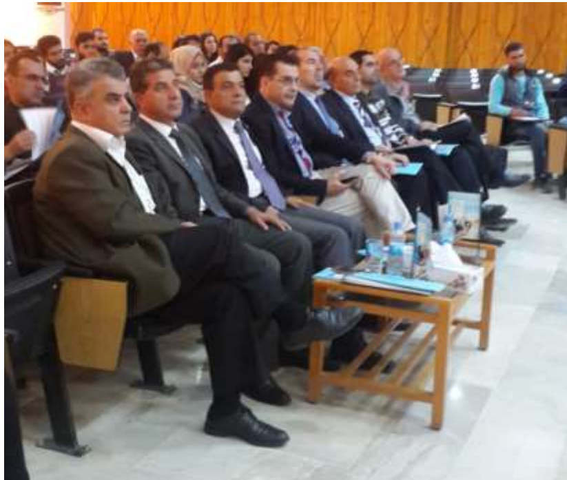
Picture2: the audience