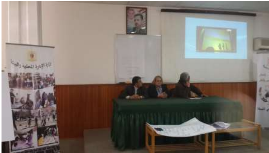
Picture19: another head session of the workshop activities