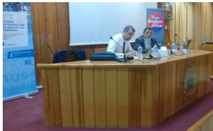
Picture5: the head of the session