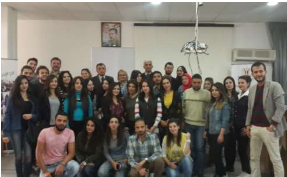
Picture20: picture of all participants in the activities of the workshop

The training workshop, which was held in cooperation with The Environment and Local Administration Ministry in cooperation with the Higher Institute for Environmental Research, was end on 13/11/2017, a questionnaire was distributed to participants indicated that the results of this workshop was a set of initiatives that will be presented by the workshop participants to the The Environment and Local Administration Ministry (environmental awareness directorate) to be supported by Environment and Local Administration Ministry in collaboration with the Higher Institute for Environmental Research and Erasmus+ Projects.